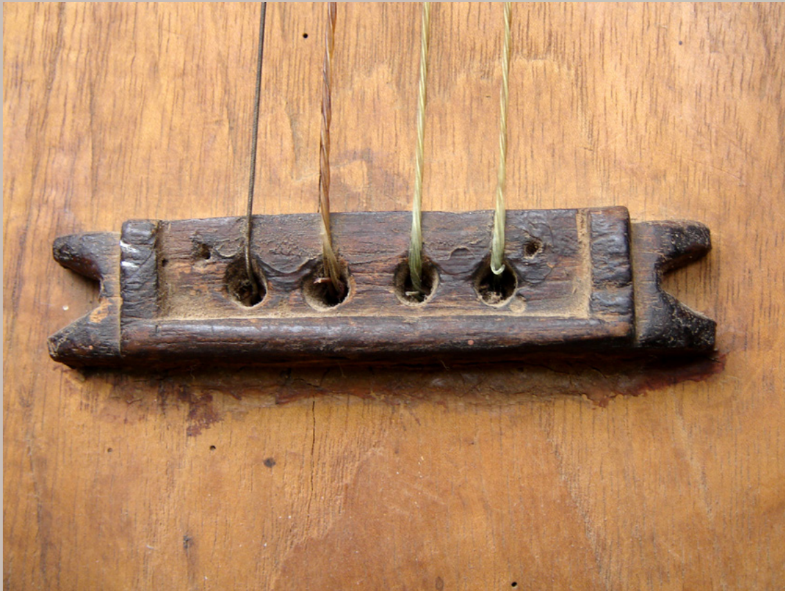
Arch. F. Ruy Guerrero.

Otro aspecto interesante es la existencia de un diapasón que si bien es añadido al brazo, está nivelado al ras de la tapa, conformación prácticamente abandonada en los instrumentos jarochos actuales. Se ha observado que instrumentos similares a este han sido intervenidos y modernizados.