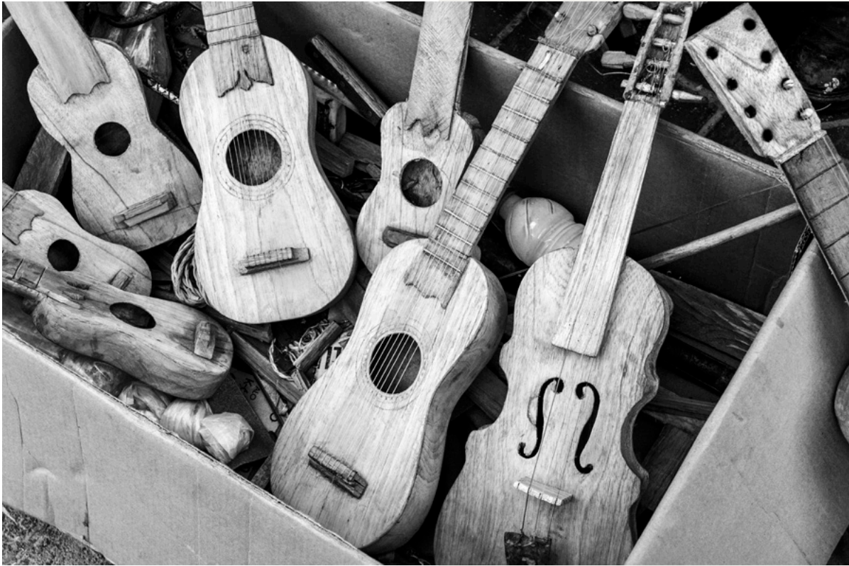
Instrumentos de los hermanos Escribano a la venta, Tlacotalpan, Ver., 2007.